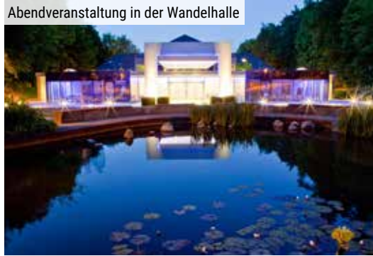
Abendveranstaltung in der Wandelhalle