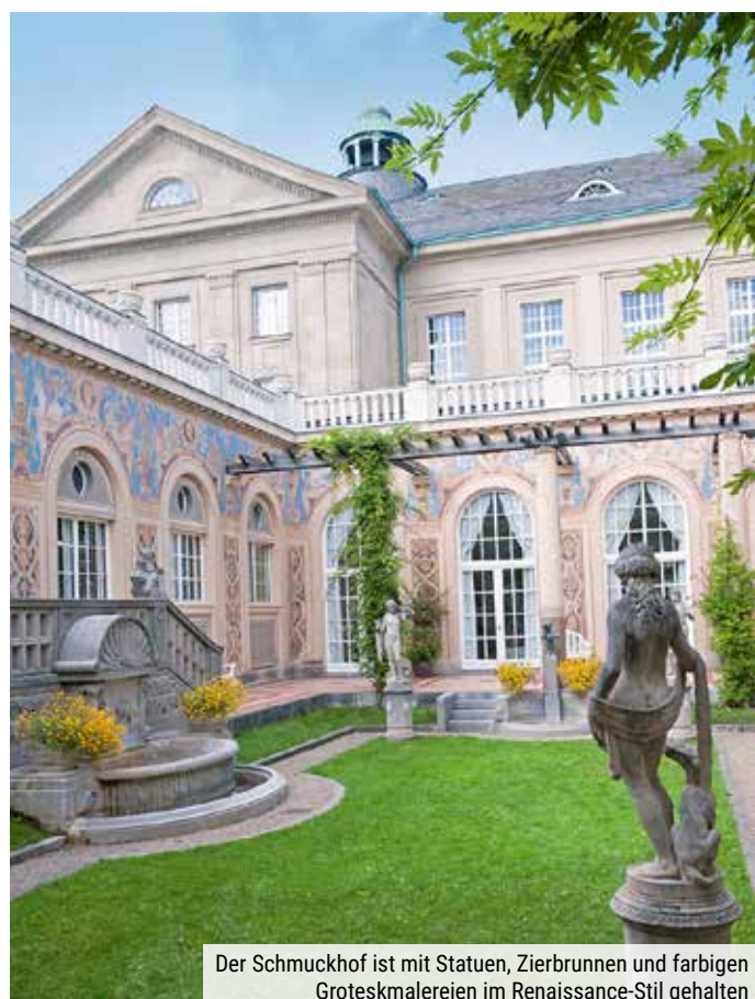
Der Schmuckhof ist mit Statuen, Zierbrunnen und farbigen Grotteskmalereien im Renaissance-Stil gehalten

Geprägt ist das Bild der Stadt vor allem durch die prächtigen Parks und die prunkvollen historischen Bauten. Hier stehen der Kurgarten mit Wandelhalle, Arkadenbau und Regentebau sowie die Bayerische Spielbank mit ihrer spektakulären Mischung aus barocker und moderner Architektur hervor. Besonders sehenswert sind unter anderem das Bismarck-Museum in der Oberen Saline, der Rosengarten mit seinen fast schon betörenden Düften und die historische Altstadt mit Boutiquen und typisch fränkischer Gastronomie.