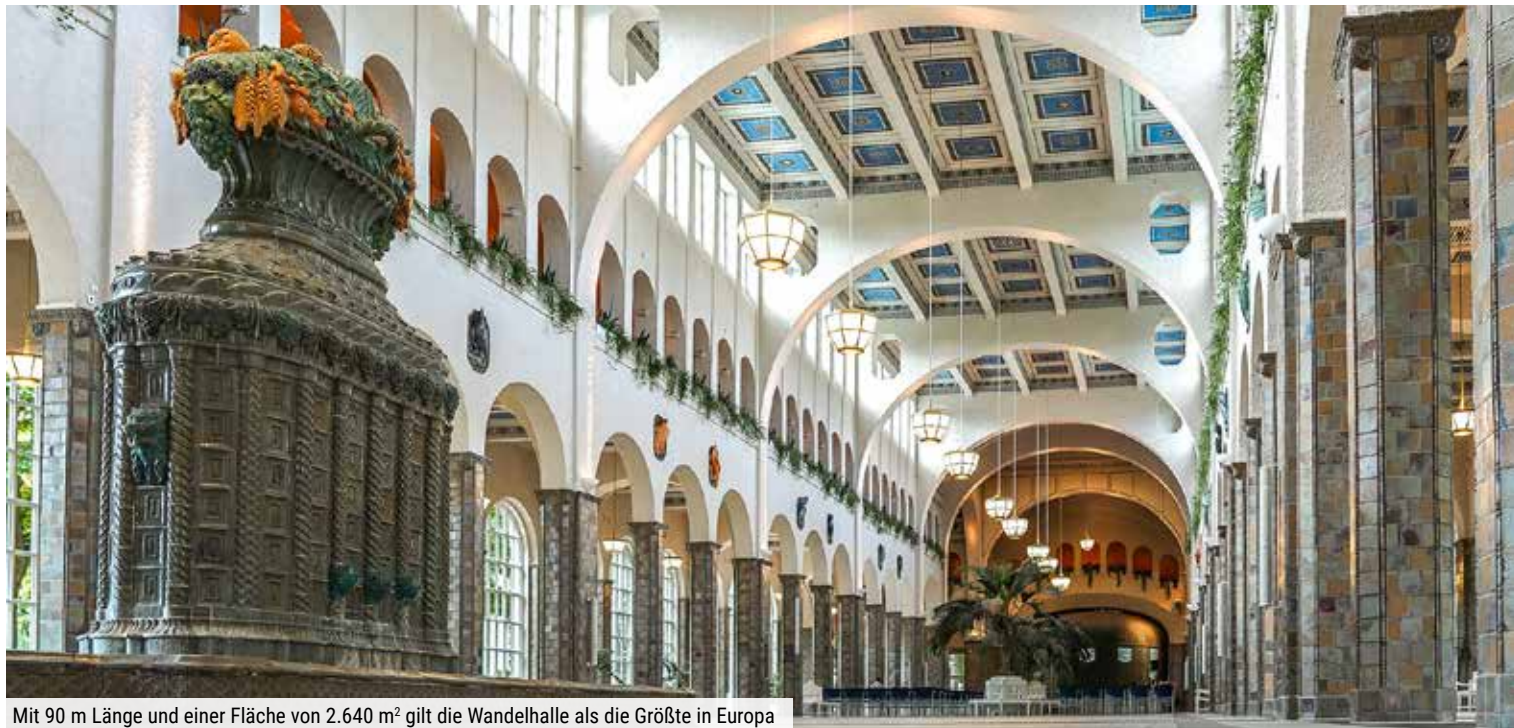
Mit 90 m Länge und einer Fläche von 2.640 m 2 gilt die Wandelhalle als die Größte in Europa