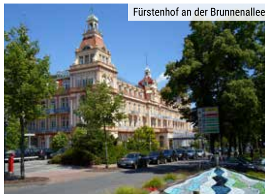
Fürstenhof an der Brunnenallee