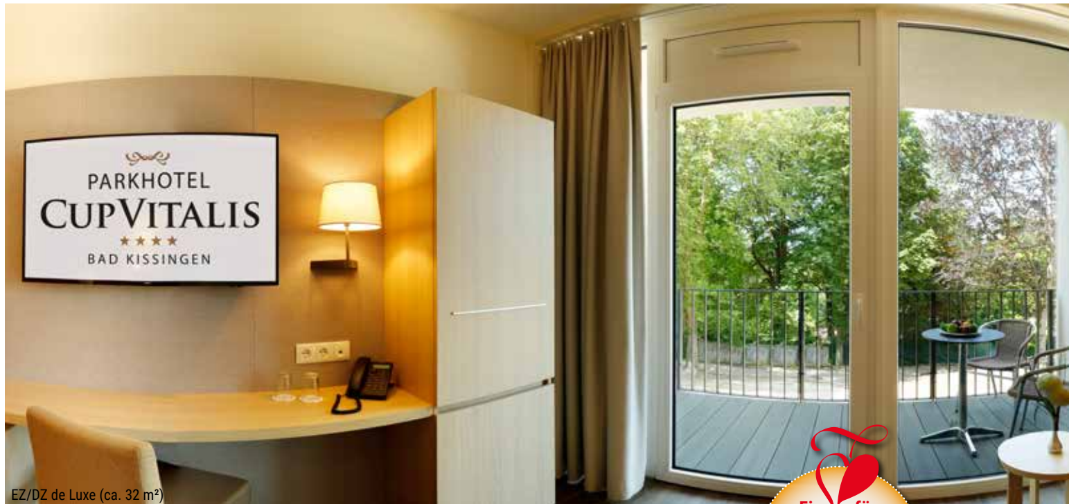
EZ/DZ de Luxe (ca. 32 m 2 )