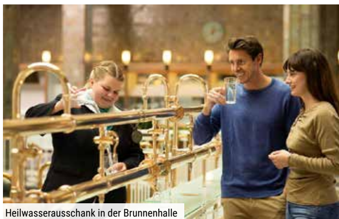
Heilwasserausschank in der Brunnenhalle