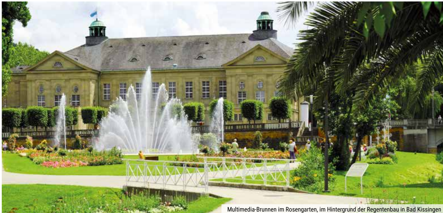
Multimedia-Brunnen im Rosengarten, im Hintergrund der Regentenbau in Bad Kissingen