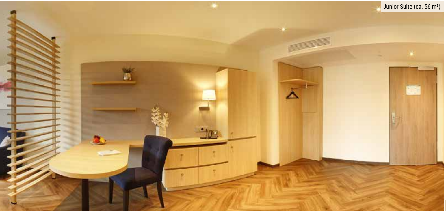
Junior Suite (ca. 56 m 2 )

Das Parkhotel CUP VITALIS bietet zudem eine Auswahl von Kopfkissen für Ihren individuellen Bedarf. Auf einigen Etagen finden Sie eine Maxi-Bar (Getränkeautomat) mit einer Auswahl an gekühlten Softdrinks und alkoholischen Getränken sowie Gäste-Waschmaschinen und Trockner.