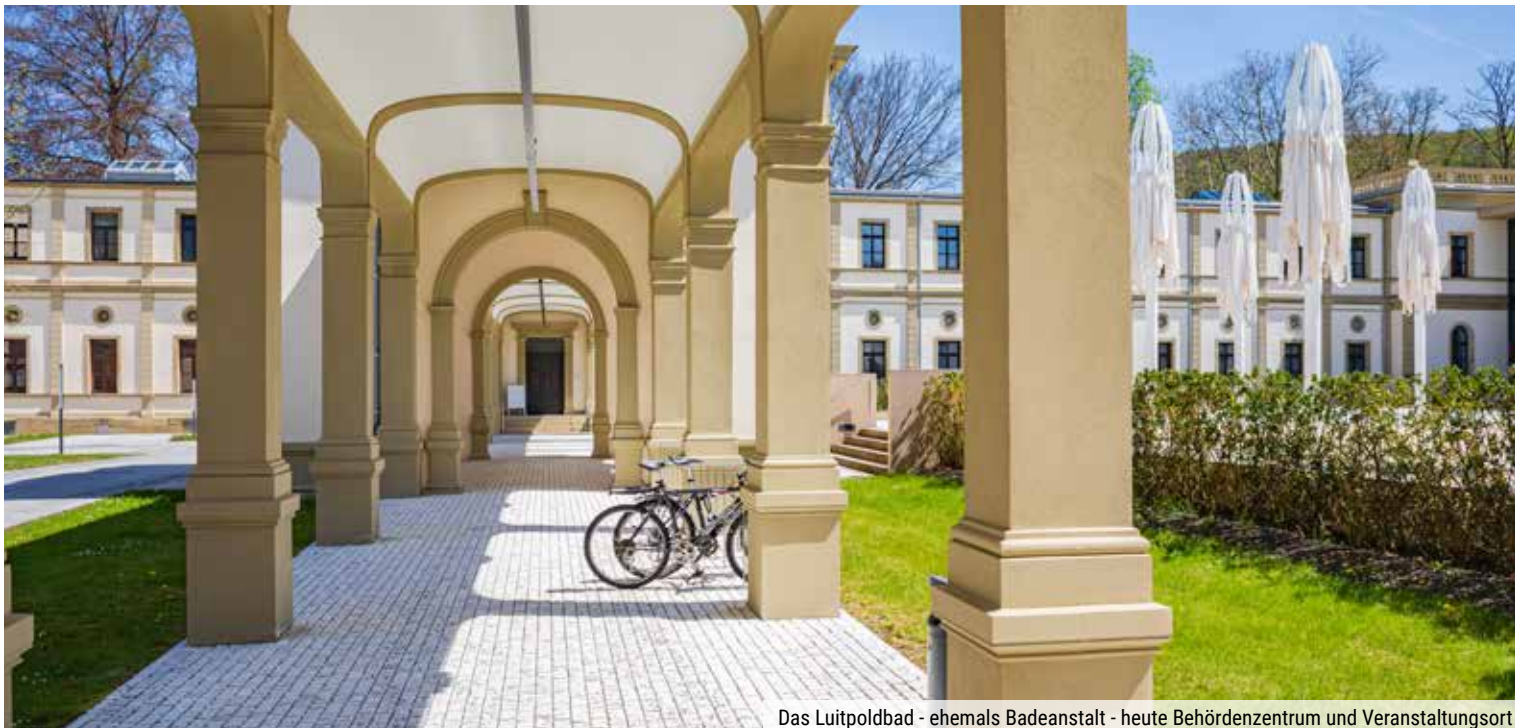
Das Luitpoldbad - ehemals Badeanstalt - heute Behördenzentrum und Veranstaltungsort