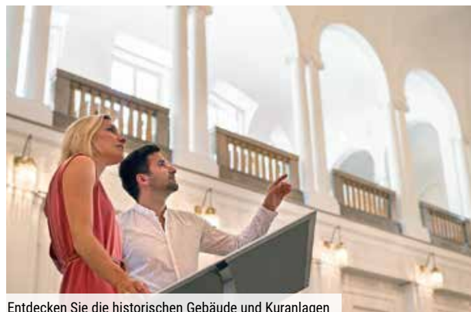
Entdecken Sie die historischen Gebäude und Kuranlagen