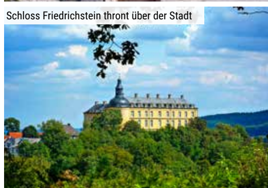
Schloss Friedrichstein thronet über der Stadt