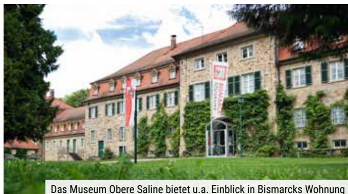
Das Museum Obere Saline bietet u.a. Einblick in Bismarcks Wohnung