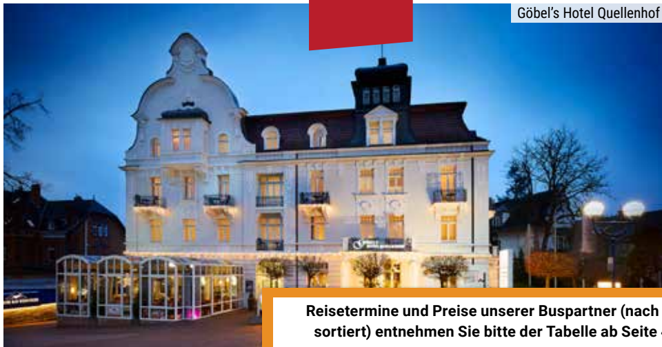
Göbel's Hotel Quellenhof