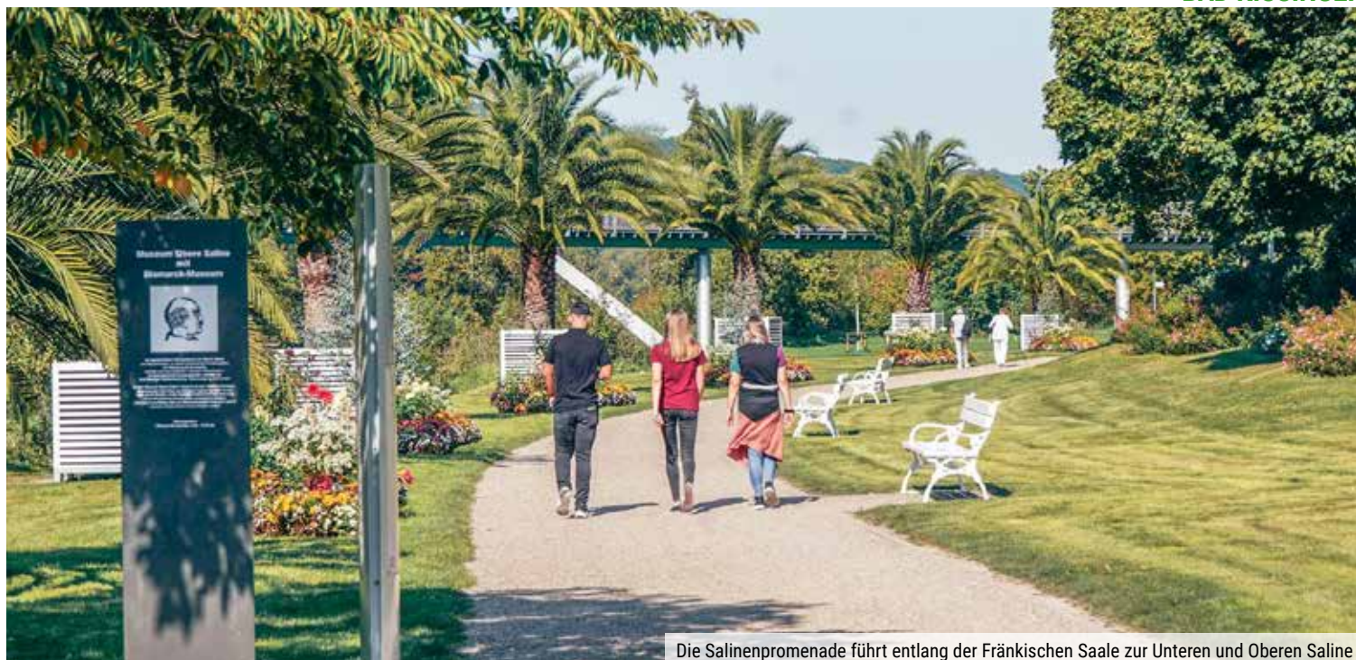
Die Salinenpromenade führt entlang der Fränkischen Saale zur Unteren und Oberen Saline