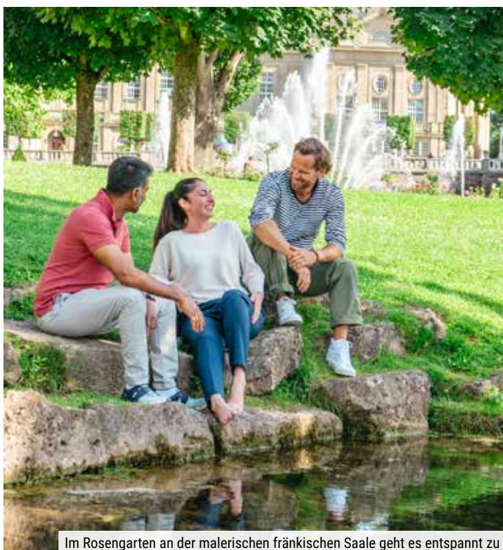
Im Rosengarten an der malerischen fränkischen Saale geht es entspannt zu

Ob in Bad Kissingen oder in Bad Wildungen – mit CUP VITAL wird Ihr Urlaub zur entspanntesten Zeit des Jahres. Erleben Sie Kurorte mit historischer Architektur und prächtigen Parks und genießen Sie ein umfangreiches Leistungspaket! Tun Sie sich und Ihrer Gesundheit etwas Gutes! Viele Anwendungen sind schon im Preis enthalten. Bei Anreise mit Ihrem PKW oder mit der Bahn bieten wir Ihnen besonders günstige Preise. Und mit der bequemen Fahrt im Reisebus oder mit dem HOTEL-TAXI ist bereits die An- und Abreise Erholung pur!