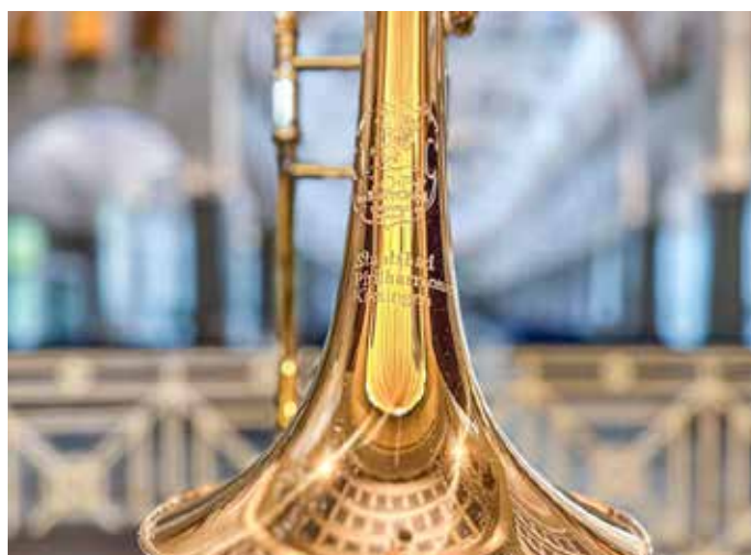
Die Konzerte der Staatsbad Philharmonie Kissingen werden Sie begeistern!