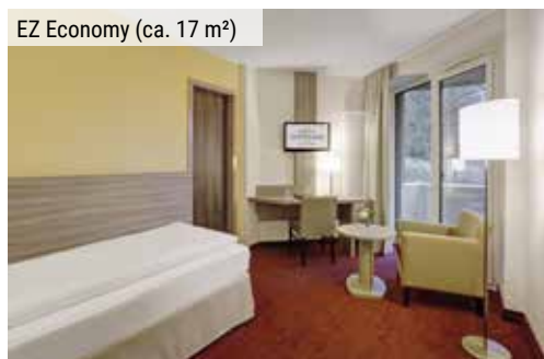
EZ Economy (ca. 17 m 2 )