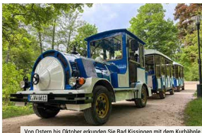
Von Ostern bis Oktober erkunden Sie Bad Kissingen mit dem Kurbahnle