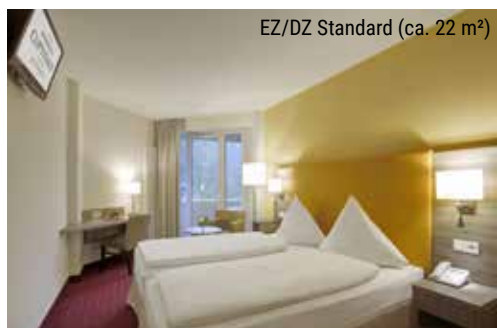
EZ/DZ Standard (ca. 22 m 2 )