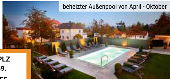
beheizter Außenpool von April - Oktober